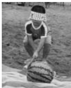
ひと夏のおもいで おいが割り