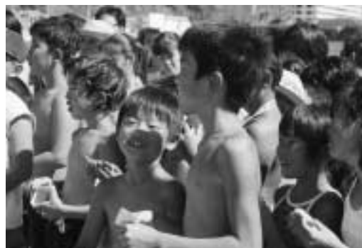
何が当たるかな? 宝さがし