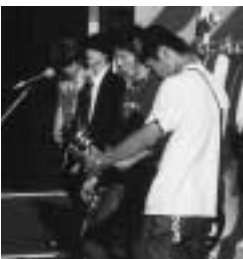
地元バンドによる熱演