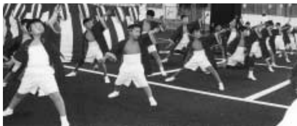
浜町 子どもたちによる めざこいりーラン

8/10(土)、サマーフェスタIN天津小湊が行われました。 昼からはじまったこのイベントに約10,000人のお客さんが ドッと押し寄せました!