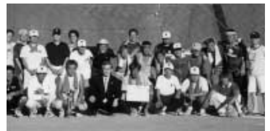
準優勝 東恵メッツ