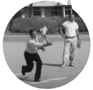
町長の始球式でつしイボール！

8月14日(水)、第21回町民(300歳)ソフトボール大会が行われました。9人全員の年齢を足して300歳以上が参加条件のこのゲーム。参加したチームは全部で16、約300人で壮絶な戦いが行われました。炎天下のなか、見事優勝を勝ち取ったのは遊友軍団のみなさんです！お疲れ様でした！