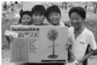
扇風機があたったよ!! 8/4・5 二夕間・城崎にて ↑