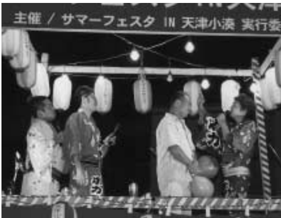
お笑いタレント・ボカスカジャンによるステージ