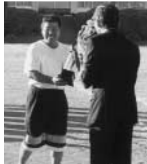
助役からトロフィーが渡されました