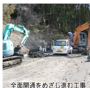
全面開通をめざし進む工事

鴨川北部地区に整備が進む農道「北部道路」の一部が、4月から開通します。供用区間は栗斗地区から東町地区までの約3.0km。迂回路により、県道天津小湊田原線と接続できます。この事業は、地域農業の振興などを目的に、県が主体となっており、平成20年4月を目標に整備される予定です。これにより、打墨地区から天津地区を結ぶ、全長約5.1kmの新ルートが完成します。