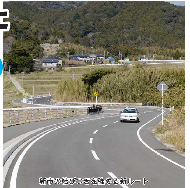
新市の結びつきを強める新ルート