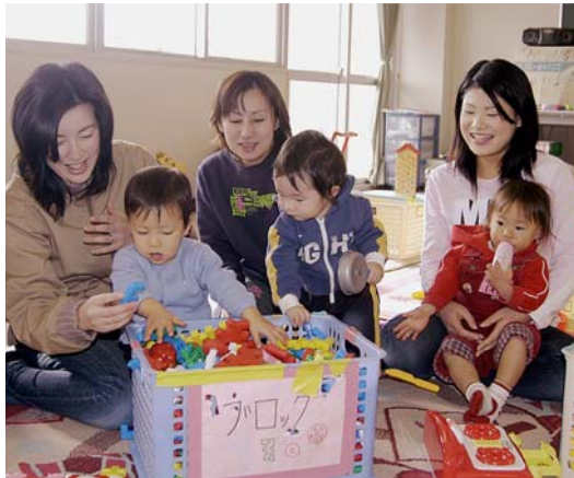
子育て世帯を応援します

来年少子化や核家族化が進むなか、市では、安心して出産や子育てができる環境づくりに取り組むと、来年4月から、長狭地区で「幼保一元化」の試みを始めます。これは、吉尾幼稚園・保育園を一体的に活用することで、「2年間の幼稚園教育」と「預かり保育」を行うものです。これにより、同幼稚園では5歳児に加え、新たに4歳児の受け入れを始めるほか、預かり保育(午前7時30分~9時、午後2時~6時)などのサービスを提供します。希望すれば、主基地区や大山地区など他地区からの入園も受け付けます。1月10日から吉尾幼稚園で申し込みください。