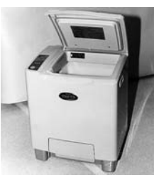
機械式生ごみ処理機

美しいまちづくりを進めている市では、ごみの減量化やリサイクル活動に、費用の一部を補助しています。 「渚百選」「棚田百選」など、全国に誇れる景観が多いことも、大きな特徴です。「市章」をデザインするためには、まず、市の姿やまちづくりの将来像を知ることが大切です。この機会に、もう一度、まちの魅力や特色について見つめ直してはいかがでしょうか。