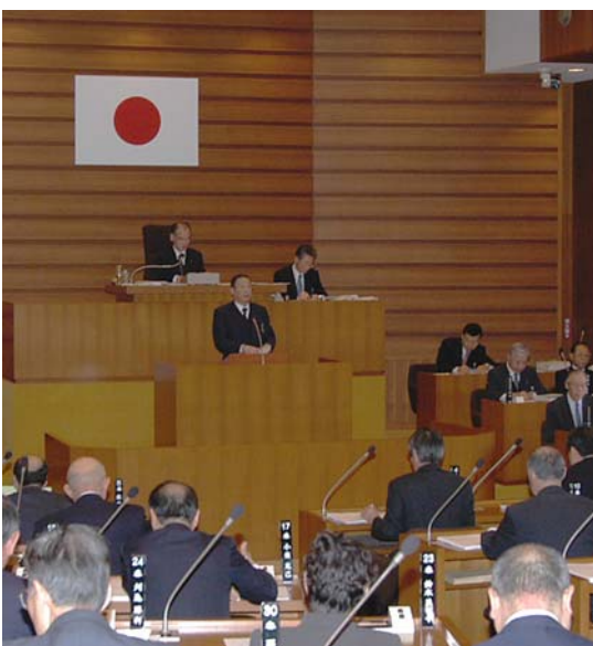
10議案を可決した第1回定例市議会