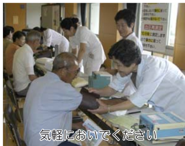
気軽においでください

●編集発行・鴨川市役所市長公室 広報広聴係 ●電話・04(7093)7827 ●FAX・04(7093)7850 ●住所・〒296-8601 鴨川市横渚1450 ●ホームページ http://www.city.kamogawa.lg.jp/