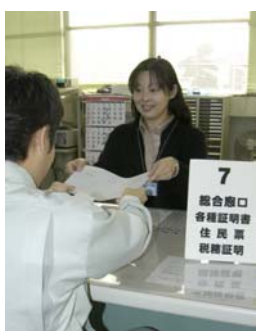
お気軽においでください