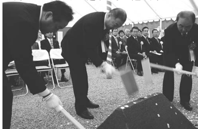
8月26日に行われた建築工事の起工式

このほか、格技場は、鉄筋コンクリート造、地上1階、632平方メートル。柔道場や剣道場などを整備します。 さらに、屋外施設としては、両翼90メートルの野球場をはじめ、テニスコート4面、1周300メートルの陸上トラックやサッカー場など敷地を有効に活用して整備を進めます。 この事業の総事業費は、用地費なども含め約45億円。市では、国庫補助金や合併特例債などを有効に活用し、市の財政負担を大幅に削減しながら学校整備に取り組んでいます。 今年度は、8月20日(木)の市議会臨時会で可決された工事請負契約の締結に沿って、校舎や屋内運動場、格技場の建築に着手。このほか野球場の整備や各種の