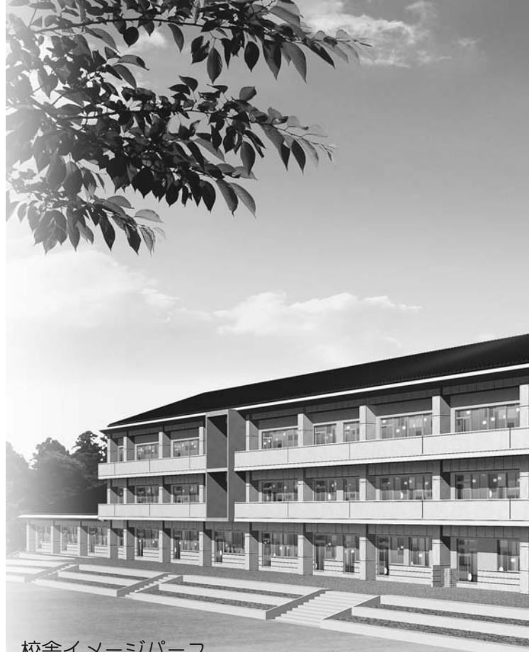
校舎イメージパース

平成5年には春の叙勲を受章、数多くの功績が認められ平成8年11月には名誉市民となりました。