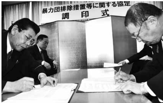
▲暴力団排除に関する協定を鴨川警察署と締結