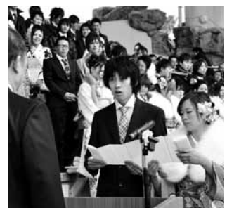
△昨年の様子 「実行委員として緊張はありましたが、貴重な経験ができて、心に残る成人式となりました。」

■申し込み 7月13日(金)までに天津小湊支所2階の生涯学習課 ☎(7094)0515・ファックス(7094)0531)、メール(seijinshiki@city.kamogawa.lg.jp)へ