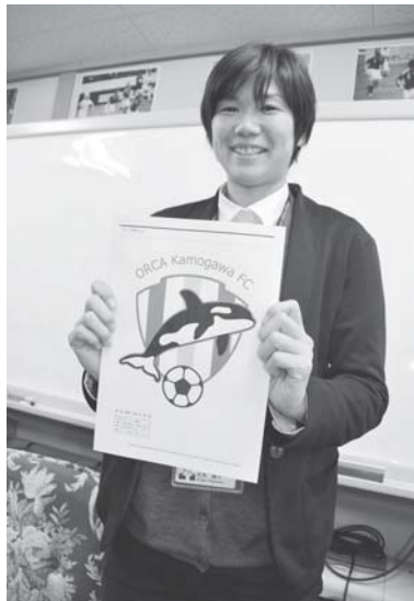
2月13日に行われた記者会見ではチームのロゴを披露

北海道札幌市出身。30歳。2004年にさいたまレイナスFC（現在の浦和レッズレディース）に入団。2006年になでしこリーグに出場。その後、なでしこリーグ優勝、なでしこリーグベストイレブンに選出されるなど輝かしい戦歴を持つ。2011年に現役を引退し、埼玉県で女子サッカーの普及、育成の指導に当たっていた。