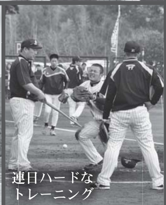
連日ハードなトレーニング