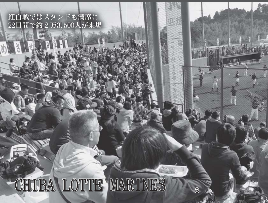
紅白戦ではスタンドも満席に22日間で約2万3,500人が来場