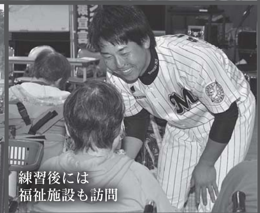
練習後には福祉施設も訪問