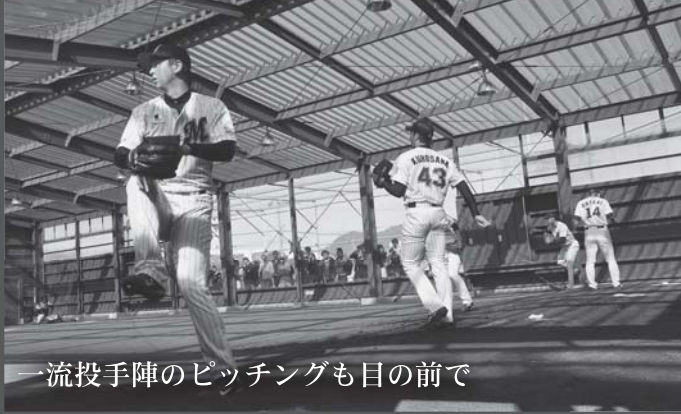
一流投手陣のピッチングも目の前で