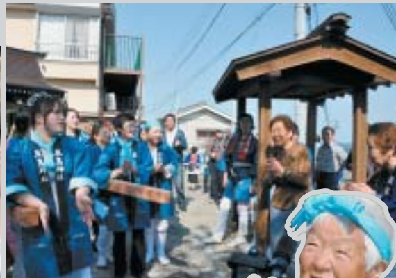
元気な木やりが響き渡りました