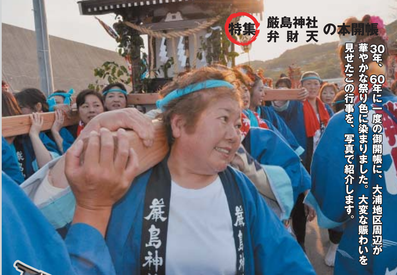
威勢のいい女性衆の「輿」

30年、60年に一度の御開帳に、大浦地区周辺が華やかな祭り色に染まりました。大変な賑わいを見せたこの行事を、写真で紹介します。