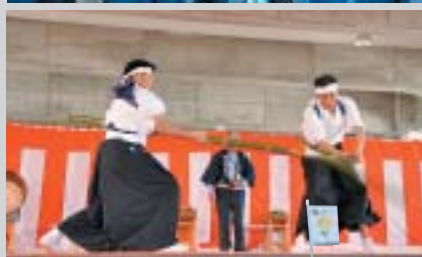
市指定無形民俗文化財 「和泉の三役」