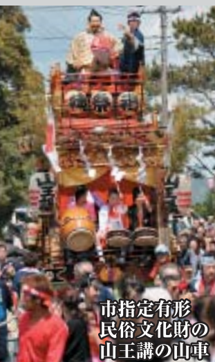
市指定有形 民俗文化財の 山王講の山車