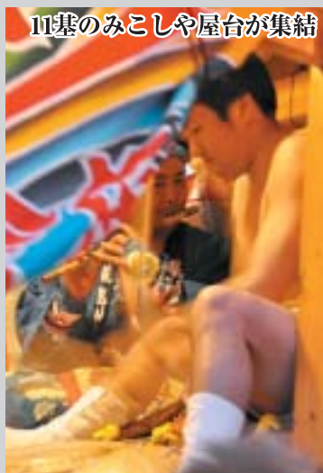
11基のみこしや屋台が集結