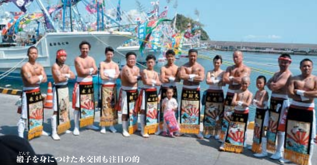
どんす 緞子を身につけた水交団も注目の的