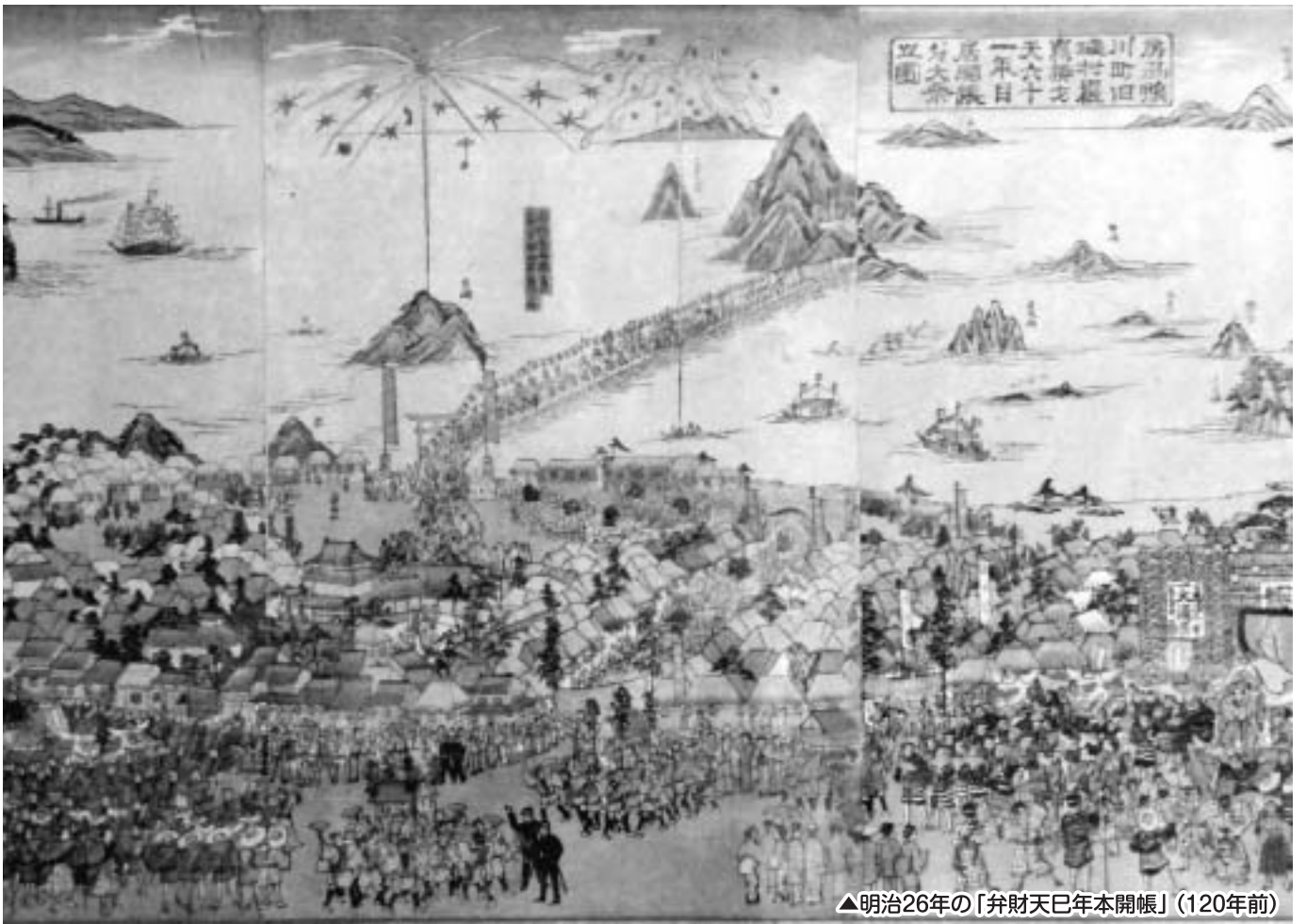
▲明治26年の「弁財天己年本開帳」(120年前)