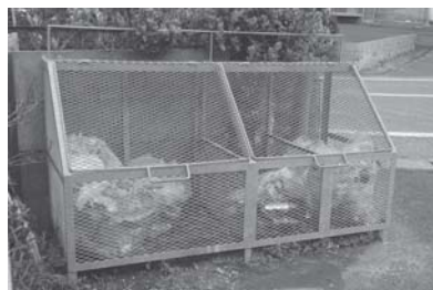
◎ごみ集積施設に掲げる看板を無料で差し上げます

▽対象 市内のおおむね10戸程度の隣組などが設置するごみ集積施設 ▽補助額 1施設につき事