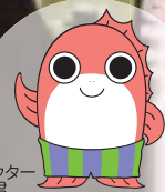
市キャラクター だいやろ君