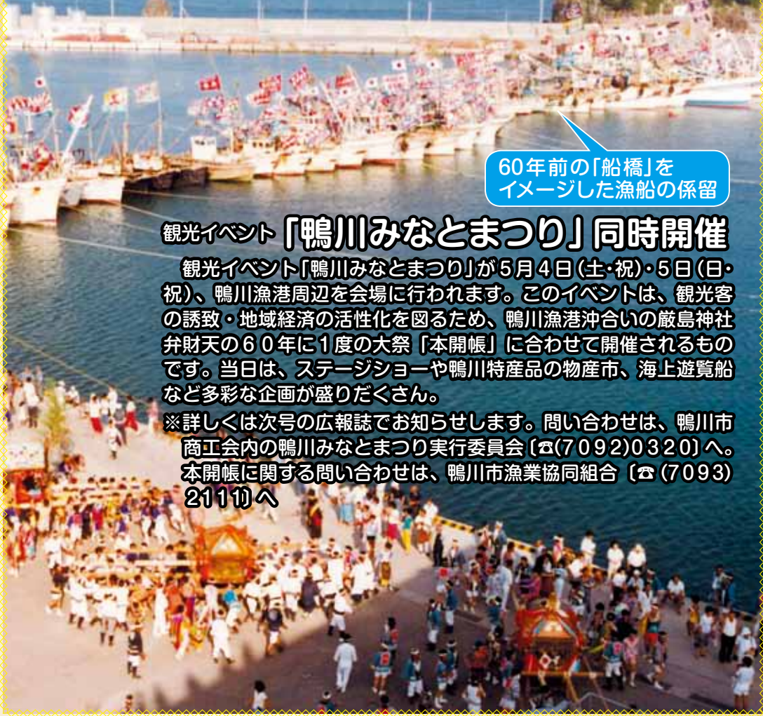
60年前の「船橋」をイメージした漁船の係留