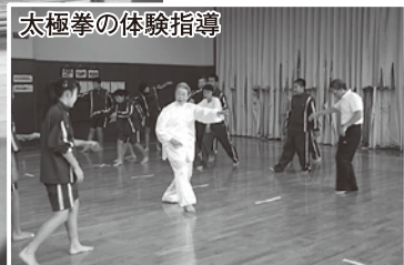
太極拳の体験指導