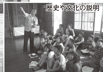
歴史や文化の説明