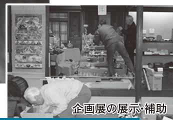
企画展の展示・補助

市民一人ひとりが輝く生涯学習のまちづくり」を目指して—。 市では、「だれでも、いつでも、どこでも」学べるまちづくりのため、 地域で活動していただけるボランティアを募集しています。