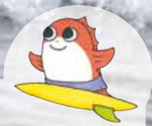
市キャラクター たいよう君