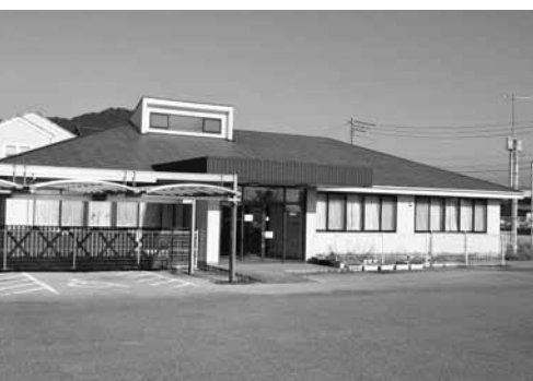
▲子育て総合支援センター

子育て総合支援センター施設の利活用のため、（一）社）こども未来共生会に対し、平成29年4月1日から