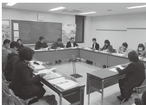
▲保護者代表も検討に参加

来年4月に開校する天津小湊地区統合小学校の校名が、「天津小湊小学校」に決まりました。今後は、校章や校歌の選定、両校の児童の交流活動を行い、スムーズな開校に向けて準備を進めます。