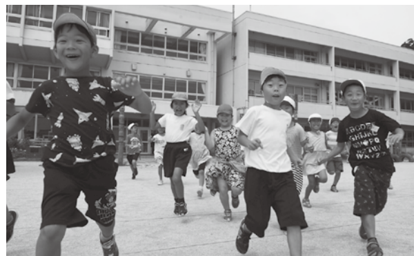
▲校舎は天津小学校を活用

り校名が決定しました。小湊地区はスクールバス通学へ 天津小湊小学校は、現天津小学校の校舎や体育館を活用します。 小湊地区の児童は、スクールバスで通学することになるため、運行時刻や乗降場所などの調整を進めていきます。 今後は、定期的に両校児童の交流活動を行い、スムーズな開校を目指します。