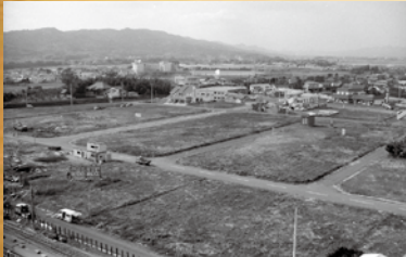
▲光潮ビル上より西側を臨む・現鴨川駅西口(昭和62年)

鴨川漁港や天津・小湊小学校、嶺岡トンネルなど、初公開となる年代物の写真をはじめ、時代を映す資料なども紹介。来年統合する天津小学校、小湊小学校に関する珍しい写真も展示します。