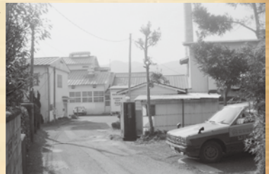
▲明治乳業主基事務所(昭和62年)