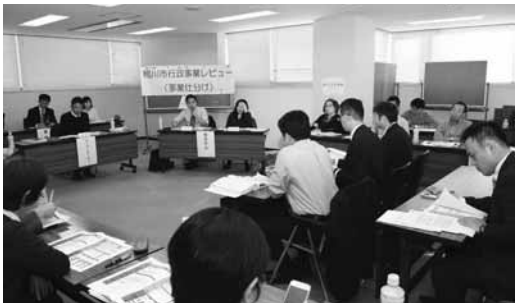
▲市の事業について考えてみませんか