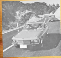
◀鴨川有料道路が開通(昭和42年)

平成が終わりを迎えようとするなか、昭和という時代も歴史上のものとなりつつあります。過ぎ去っていく時代を思い出し、ご家族やご友人と懐かしんでみませんか。