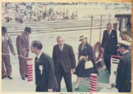
▲昭和天皇行幸啓 鯛の浦遊覧船発着場(昭和48年)