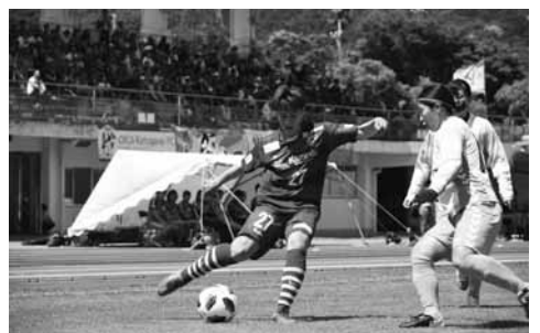
▲スポーツを通じた地域活性化にご意見を

■応募先・問い合わせ 〒296-0001 鴨川市太尾866番地1 スポーツ振興課（☎（7093）5111）へ。公募申込書は同課に備えてあるほか、市ホームページからも印刷することができます。