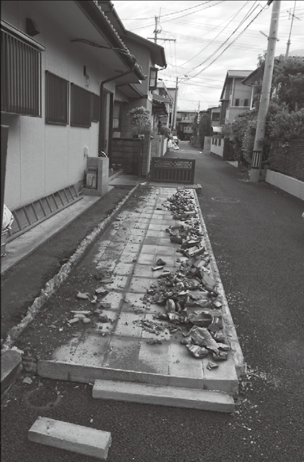
▲熊本地震で倒壊したブロック塀

左図のチェックポイントで確認を行い、心配な方は市で「無料安全点検」を実施しますので、ご利用ください。