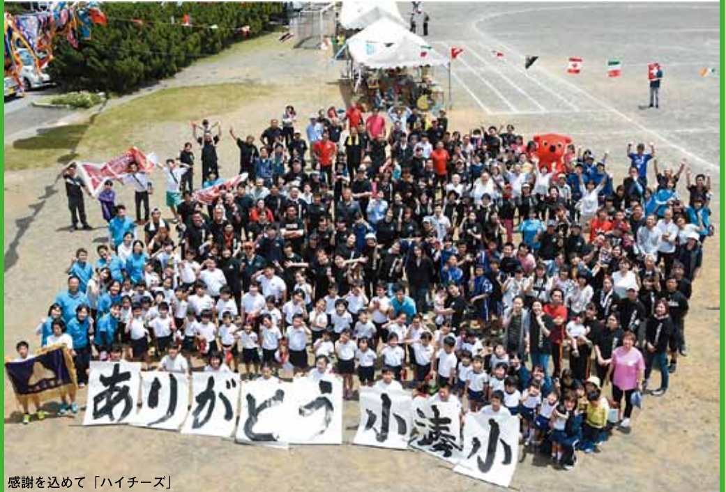
感謝を込めて「ハイチーズ」

「熱いバトンを未来へつなげ！」一。来年度に統合を控えた小湊小学校の運動会が、5月19日に行われました。同校で行う最後の運動会には、園児・児童のほか、保護者や地域住民など約400人が参加しました。この日用意されたプログラムは、綱引きや玉入れ、二人三脚など全28種目。会場狭しと駆け回る子どもたちの姿や、小学校時代に戻ってハッスルする大人たちの様子に、応援席から声援が送られていました。運動会の合間には、参加者全員で記念撮影も行われるなど、地域一体となってイベントを盛り上げていました。