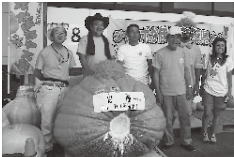
みんなで大きく育てましょう!

また、全国大会優勝者からの指導により、継続的に安定的な生産を確保し、ジャンボかぼちゃの聖地とし