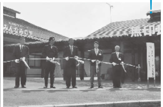
▲4月26日に行われたプレオープンで関係者を集めたテープカット

「甘夏が大量に採れるので売れる新製品を生み出したい」など、地域の皆さんの声を伺いながら、地元の農