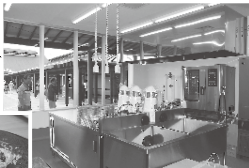
▶加工品のブランド化に取り組む「開発工房」