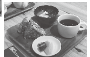
▲「鴨川野菜の押し寿司」(1,000円)