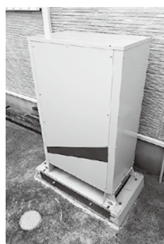
▲定置用リチウムイオン蓄電システム