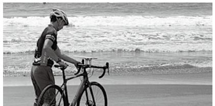
▲自分のペースで楽しめます