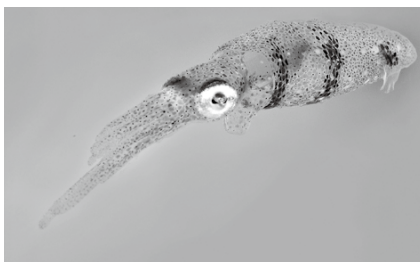
▲世界最小のイカ「ヒメイカ」