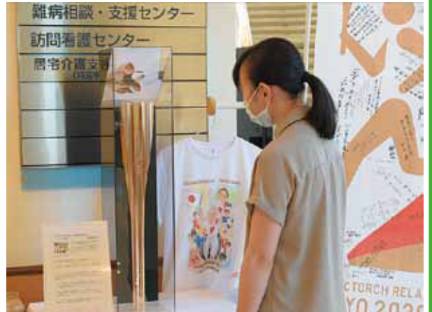
▲亀田総合病院での展示の様子