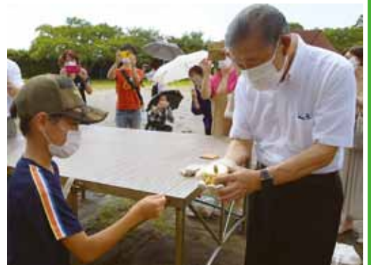
▲市長がランタンで火を付けました

オリンピック・パラリンピック教育推進校に指定されている西条小学校で8月18日(水)、東京パラリンピック聖火の採火が行われました。児童たちは、ライターやマッチを使わず、木の棒を回転させ摩擦熱を利用するマイギリ式(表紙写真)や、硬い石と鋼鉄を打ち合わせる火花式で、火種作りにチャレンジ。いくつかのグループが火花式で火をおこすことに成功しました。