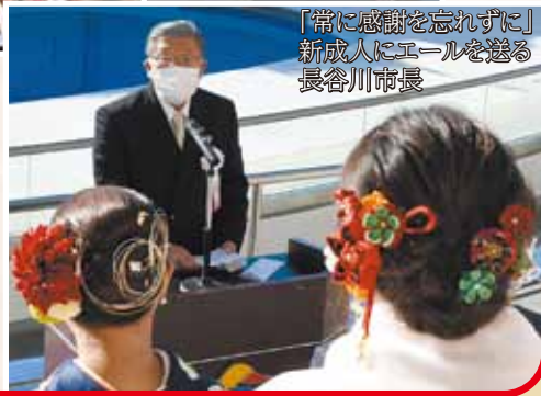
「常に感謝を忘れずに」 新成人にエールを送る 長谷川市長

記念写真を配布 ④生涯学習課【☎(7094)0515】へ 成人式に出席された方へ、全体で撮影した記念写真を配布しています。受付票または写真引換券を持参の上、2月28日(月)までに、天津小湊支所2階の生涯学習課(平日のみ、午前8時30分～午後5時15分)、市役所1階の総合窓口(土・日曜日・祝日も開設、午前8時30分～午後5時15分、火曜日のみ午後7時まで)でお受け取りください。