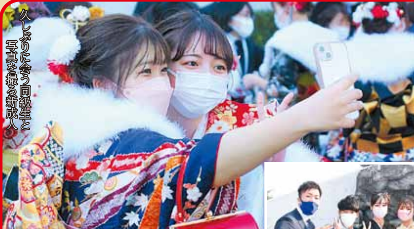
久しぶりで会う同級生と 写真を撮る新成人