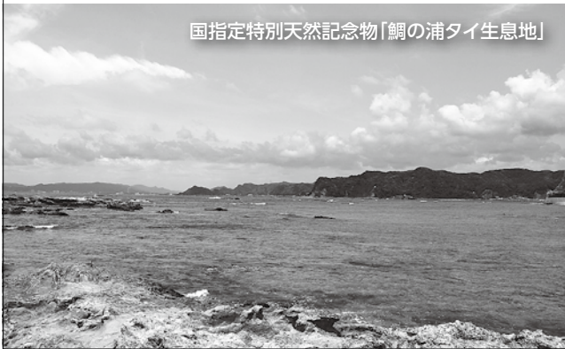
国指定特別天然記念物「鯛の浦タイ生息地」