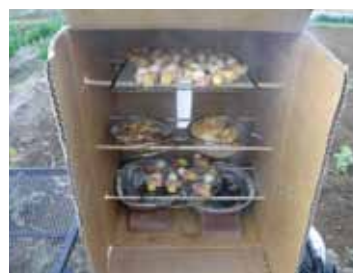
ダンボールスモーカーで 燻製づくり