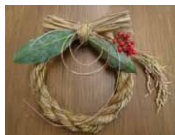
稲わらでつくる 正月飾り