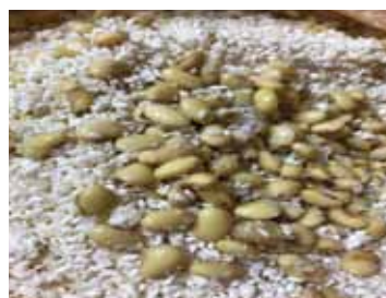
自家製みそ 仕込み体験