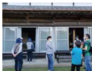
先輩移住者宅訪問 リアルな暮らしを五感で体験