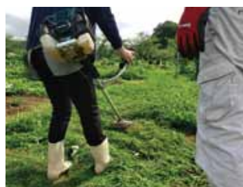
草刈り機の扱いも 学び合おう!