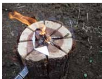
スウェーデントーチ 写真映え間違いなし!!