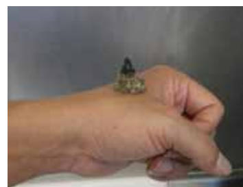
ヨモギを用いた お灸講座