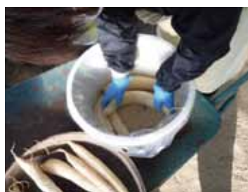
昔ながらの たくあん漬け講座

先輩移住者やもともと地域にお住まいの方も参加していますので、移住者の体験談や地域の情報を聞くことができ、移住に向けた準備や移住に対する不安解消ができるとともに、人と人との“つながり”がつけられます。