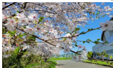
総合運動施設のサクラ