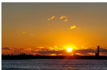
江見海岸の日の出